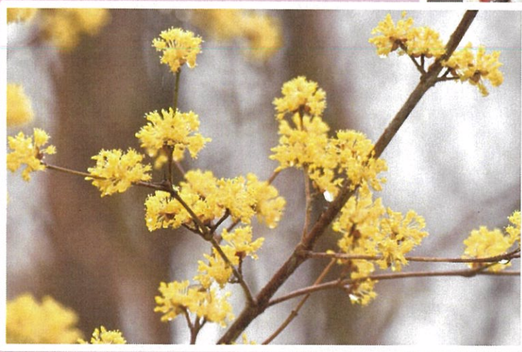
↑ 令和3年3月撮影 サンシュユの花