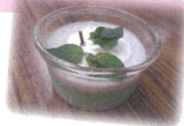
手作りの 三色ゼリーです！