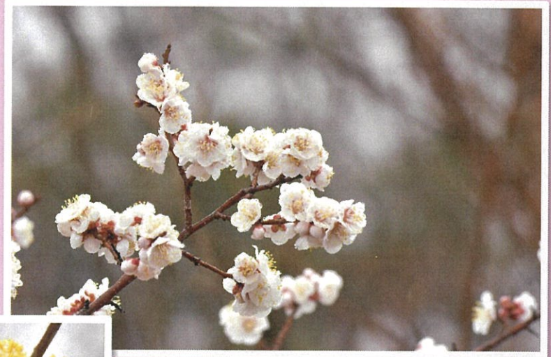
↑ 令和3年3月撮影 梅の花