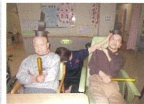
男性の利用者様も 楽しんでました！