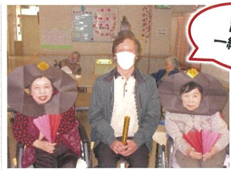
施設長と 一緒に撮影！