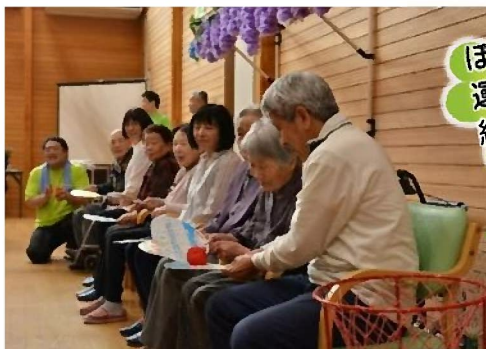
ぼたもち 運び競争！ 結構難しい！