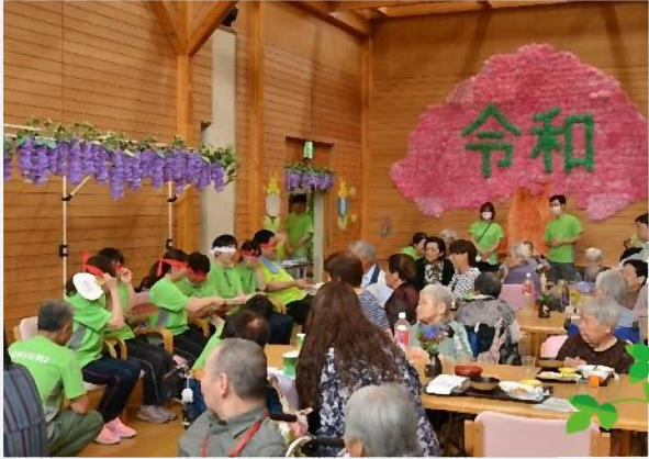
ご家族と 一緒にお食

■□■社会福祉法人篤仁会■□■ 特別養護老人ホーム愛日荘園 愛日荘園デイサービス指定通所介護センター 愛日荘園指定居宅介護支援センター 愛日荘園短期入所生活介護センター 〒960-0811 福島市大波字熊野山1番地 TEL:024-588-1120 FAX:024-588-1148 URL:http://www.ainichisouen.net/ E-Mail:ainichisouen@air.ocn.ne.jp