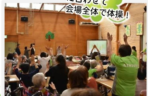
「高原列車は行く」 に合わせて 会場全体で体操！