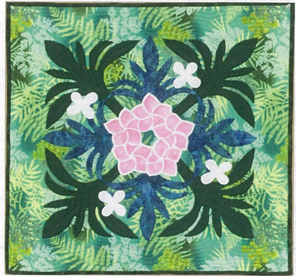
作品名：タペストリー・ハワイアンキルトと スタンドグラスのコラボレーション