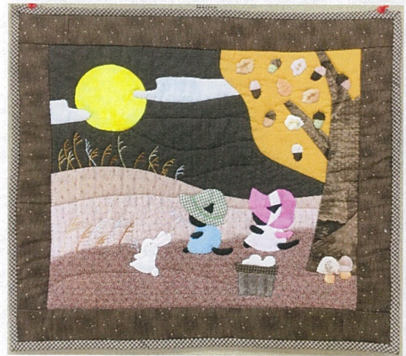
作品名：猫のお月見