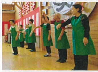
【福島市はたち会様】